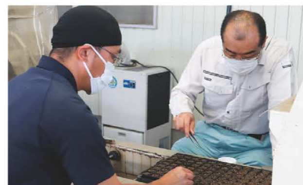
手作業で苗床を整えるJA職員

7月26日から、津市須ヶ瀬町の久居野菜育苗センターでキャベツ、ブロッコリー、ハクサイ、なばなの4種類の秋冬野菜の播種作業を行いました。育苗用播種機を使って128穴セルトレイに種をまき、一部手作業も加えて苗床を整えます。今年度は約2万1,000枚の苗を生産しました。また、松阪市の多目的育苗センターでも野菜苗約4,000枚を生産しました。