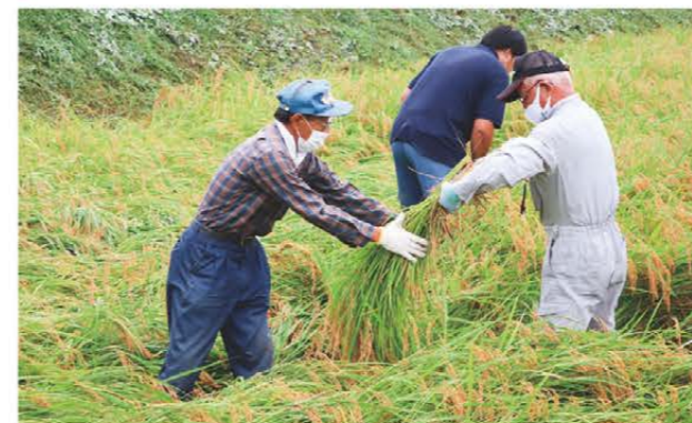
坪刈を行う部会員ら

「一志町の農業を守る会」は8月23日、津市一志地区の水稻圃場(実証田)で生育調査を行い、部会員13人が参加しました。