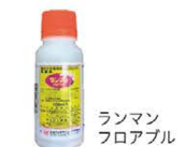
ランマンフロアブル