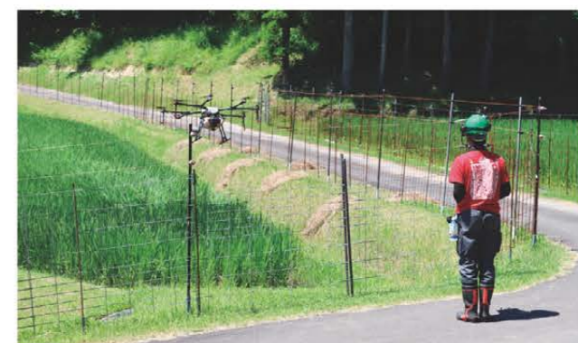
農業用ドローンを操縦するJA職員

6月25日から8月中旬まで、管内の水稲圃場約750haを対象に無人ラジコンヘリコプターと農業用ドローンで農薬の空中散布を実施しました。いもち病・カメムシ類の防除が目的です。今年は暖冬の影響により、カメムシの発生が1か月ほど早まり、越冬した個体も含めて大量に発生しました。米の成長を病害虫から守るため、長引く梅雨の晴れ間をぬって慎重に作業を進めました。