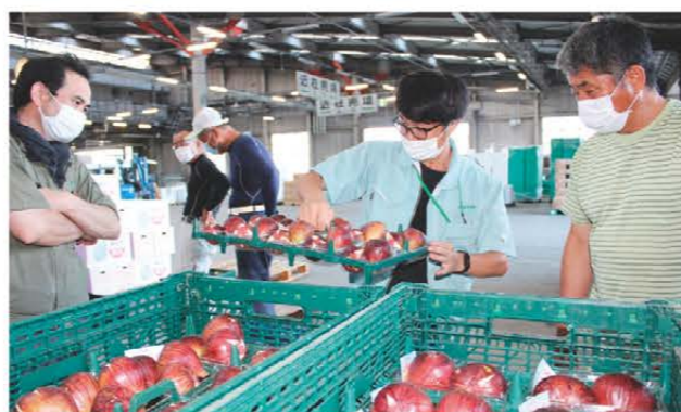
出荷規格を確認する関係者

JAみえなかいちじく部会は8月10日から、三重県地方卸売市場でイチジクの出荷を始めました。