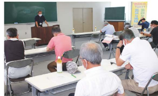
栽培講習を受ける参加者

JAみえなか秋冬野菜部会は8月5日、権現前店でブロッコリーの栽培講習会を行いました。部会員はじめ関係者21人が参加し、栽培管理や病虫害防除、農薬の適正使用などを学びました。