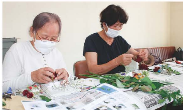
ドライフラワー作りをする参加者

介護福祉課は7月29日、あいけあセンター隣の空き店舗で第1回「ふらっと広場」を開催しました。地域住民10人が参加し、ドライフラワー作りを行いました。