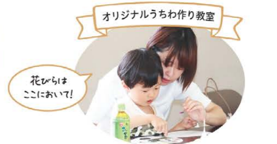
オリジナルうちわ作り教室