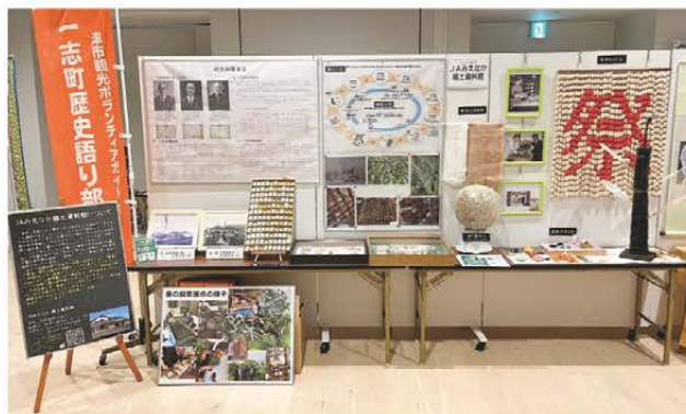
養蚕業に関する展示品がずらり

津市一志町にある郷土資料館は8月4日から8日の4日間、津市の久居アルスプラザで開催された「久居誕生350年事業 津まちかど博物館展」へ養蚕関係の展示品を出展しました。