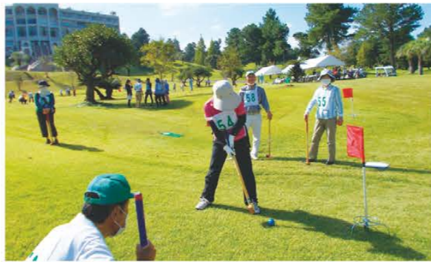
グラウンドゴルフを楽しむ参加者ら

年金友の会は10月4、5日に津市の白山ヴィレッジで、10月18、19日には松阪市総合運動公園で、2会場に分けてJAみえなか年金友の会として初めてとなるグラウンドゴルフ大会を開き、合わせて527人の会員が参加しました。