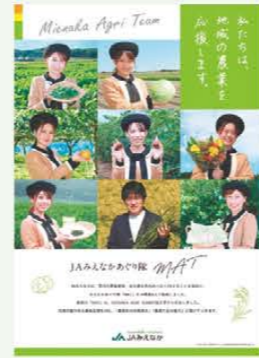
みえなかめぐり隊 （MAT）

また、JAみえなかの農畜産物を広くPRするため、季節に応じたイベントの開催やSNSによる情報発信、職員で結成した「みえなかめぐり隊（MAT）」によるPR活動を行っています。