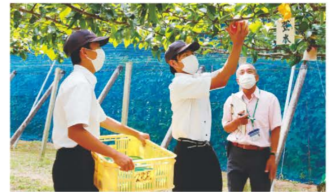
現場審査を受ける高校生

久居農林高校では9月15日、同校の植物コースが栽培・管理する青果物(日本ナシ・ブドウ)を対象にASIAGAPの更新審査が実施されました。