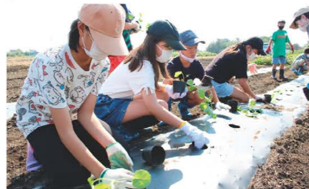
定植作業をする子どもたち

めぐりスクールは10月1日、松阪西部営農振興センター近くの農園で、ナバナとキャベツの定植体験を行い、22人が参加しました。当JA営農指導員が定植の仕方を説明し、子ども達は楽しそうに手際よく定植した後、水やりをしました。参加した子どもは「色々な野菜を植えられて楽しかった」と話していました。冬には収穫体験も予定しています。