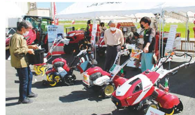
展示会の様子(嬉野・伊勢寺農機合同展示会)

JAみえなかは、10月14・15日に嬉野カントリーエレベーターで、10月21・22日に朝見農機センターで、また11月12日には白山農機センターでそれぞれ農機展示会を開催し、多くの方が来場しました。小型から大型の農機具の展示や、シロアリ相談、当JAライフアドバイザーによる農業リスク診断なども行われました。