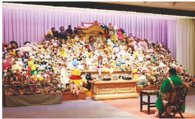
心を込めて供養する住職

虹のホール一志は10月10日、人形供養祭を行い、人形やぬいぐるみなど約2,500体が寺の住職の読経を受け供養されました。