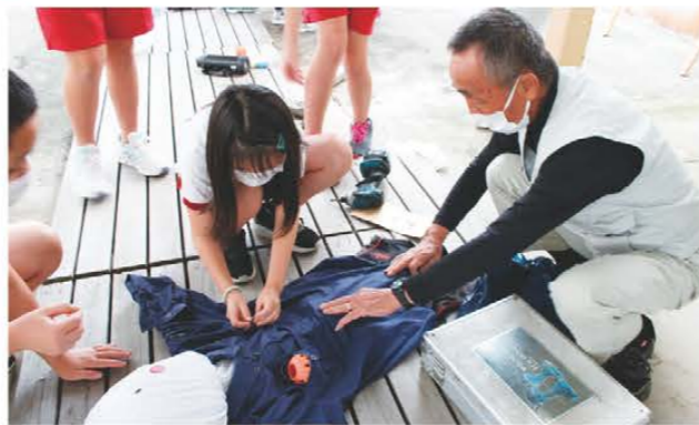
かかしづくりをする児童

松阪市立鶴小学校5年生14人は10月13日、農事組合法人笠松営農組合等の協力のもとかかしづくりをしました。この活動は地域の人々との交流を目的に、同校5年生児童が毎年取り組んでいるものです。同営農組合が事前に用意したかかしの土台に顔を描き、持ち寄った衣類を着せるなど楽しそうに作っていました。翌14日には、作ったかかしを松阪市笠松町にあるコスモス畑に設置しました。当JA三雲支店、三雲営農振興センター職員が作ったかかしも2体設置されました。