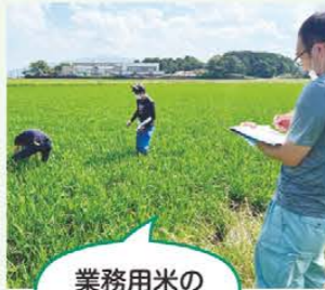
業務用米の 圃場調査

地域水田農業の維持と農業者の所得増大に向けた水田活用として、地域特性に応じた米・麦・大豆のブロックローテーションの継続支援に、行政と連携して取り組んでいます。