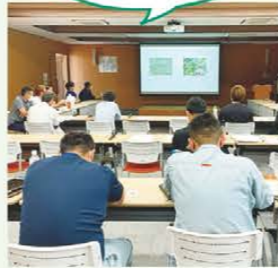
イチゴ新規栽培者 勉強会の共催

ブランド園芸品目（イチゴ・キャベツ等）について、収量・品質向上を目指し、栽培研修会や圃場巡回を実施。また、重点園芸品目（モロヘイヤ・赤シソ等）については作付面積の維持・拡大を目指し、新規栽培者の育成・支援に取り組んでいます。