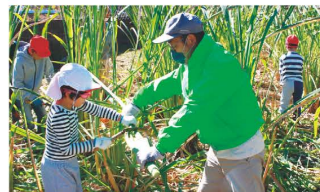
メンバーに教わりながら収穫する児童