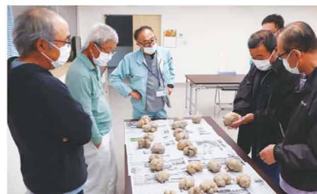
厳格な基準で規格を統一する部会員ら

伊勢芋部会は11月1日から伊勢芋の出荷を始めました。伊勢芋は丸い形をしたヤマノイモの一種で、強い粘りが特徴。三重県が選定する美し国「みえの伝統野菜」にも選ばれています。今年は雨が多く天候不順が続いていましたが、サイズが大きく、見た目も凸凹が少ない、丸い表面の質の良いものが多くできていました。