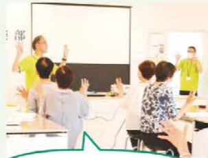
健康と笑いをテーマにした 「健康倶楽部」講座を開設

助け合い組織のボランティア活動として、ふらっとほーむやミニデイサービスの運営、配食サービスへの協力等、高齢者支援や地域住民同士の交流活動に取り組んでいます。