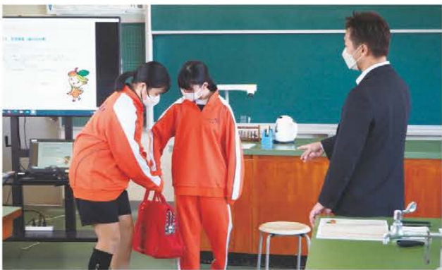
1億円のを体験する生徒ら

JAみえなからは10月14日、管内にある松阪市立東部中学校2年生の生徒に対し、JAの仕事について授業を行いました。同授業は、職場体験の替わりとして同校が昨年度から実施しているもので、地域のさまざまな企業が参加しています。