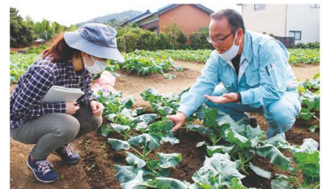
生長具合を確認するJA職員(右)ら

秋冬野菜部会は10月上旬、良品出荷を目指して圃場巡回を実施し、当JA営農指導員らが合計40戸を確認しました。巡回では、ブロッコリーやナバナなどの生長具合をみて、生産者に定植時期や追肥、防除などのヒアリングを実施。ヨトウムシ類やアオムシ等による食害被害が目立っているため、引き続き適正・適期防除に努めてくださいとアドバイスをしていました。