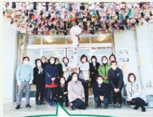
女性組織とともに地域を 盛り上げる取り組み （大足店）

地域の拠り所となる親しまれるJAを目指して、ふれあい・交流を深めることを目的に組織全体で行う「1支店等1協同活動」に取り組んでいます。