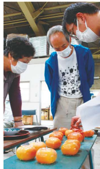
柿の色づきを確認する生産者ら

松阪地区柿生産部会では10月17日から松阪市にある当JA笹川選果場で次郎柿の出荷を開始しました。出荷初日に行われた目ざろえ会では、色づきや虫害の有無などの基準を確認しました。同部会では9戸の生産者が約4haで「次郎」と「富有」の2品種を栽培。11月中旬まで出荷が続きました。また、津市白山町でも10月14日から柿の出荷が行われました。