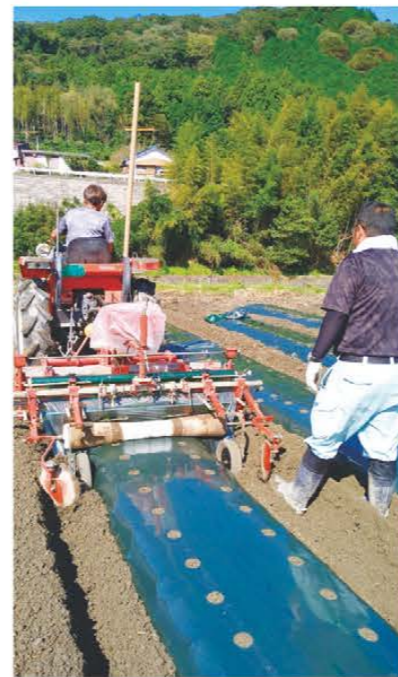
播種を行う部会員ら

露地大根部会は9月下旬から10月上旬にかけて、松阪市嬉野地区の特産物である「嬉野大根」の播種を行いました。耕起から播種までを行うことができる機械を使って圃場に種を播いていきました。