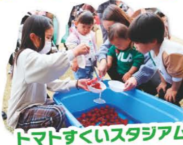
トマトすくいスタジアム