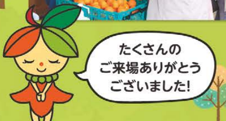
たくさん ご来場ありがとう ございました!