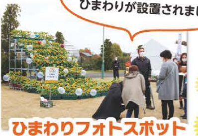
ひまわりフォトスポット