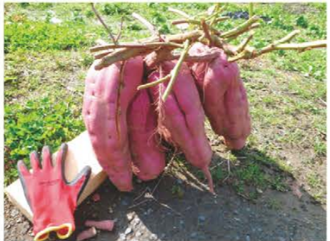
総重量10kg! 私を超えられるかな? 津市美杉町 板谷 中庸さん 80年生きていて、こんなに大きい芋で5つ子は初めてみました。総重量10kgオーバーです!