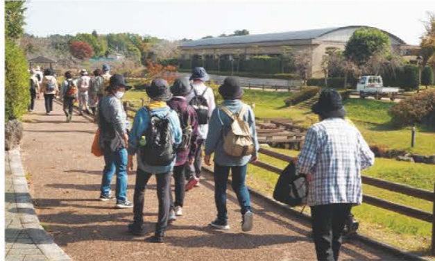
ウォーキングを楽しむ会員ら

健康倶楽部は11月4日から4日間かけ、管内3か所でウォーキングを行い、のべ85人が参加しました。同倶楽部は今年度初めて立ち上げたもので、健康を増進し、生きがいづくりに役立つ講座を年3回開講しています。今回は秋の行楽シーズンということもあり、ウォーキングを企画。初日の津市一志町のコースでは、とことめの里を出発し、徐々に色づき始めた木々などを楽しみながら約3kmを歩きました。丘の上にある公園に立ち寄りなど、休憩を挟みつつ歩いた参加者らは「いいお天気で、いい眺めだった」と気持ちよさそうに話していました。