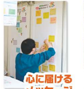
心に届ける メッセージ