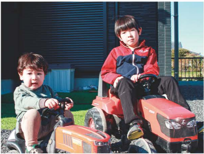
ご家族からのメッセージ 仲良く元気に過ごしてね