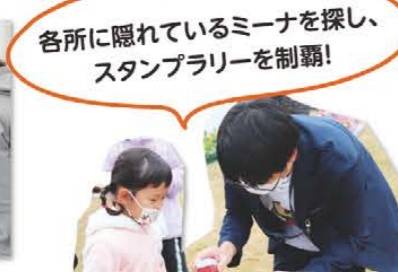
スタンプラリー ミーナを探せ!