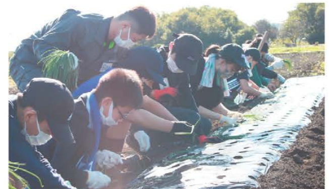
玉ねぎを定植する子ども達

あぐりスクールは11月5日、第5回の活動を行い、20人が参加しました。まずは玉ねぎの定植を行い、子ども達は穴の開いたマルチに一株ずつ苗を丁寧に植え付けていきました。その後は春の活動で定植したサツマイモの収穫。長雨の影響で昨年より収穫量が少なくなりましたが、子ども達はあちこちの畝を掘り起こし、大きなサツマイモが出てくると歓声を上げて喜んでいました。