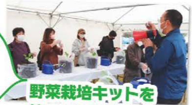
野菜栽培キットを使った無料講習会