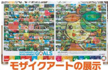
モザイクアートの展示