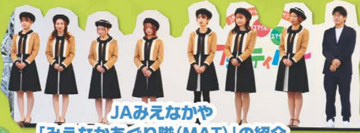
JAみえなかや 「みえなかあぐり隊(MAT)」の紹介