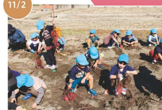
津市立 香良洲浜っ子 幼児園