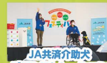
JA共済介助犬 デモンストレーション