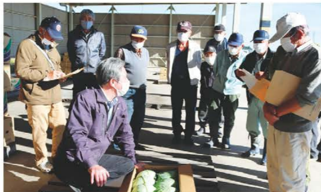
キャベツの規格を確認する部会員ら

キャベツ・はくさい部会は11月25日、新家集荷場で冬キャベツの目揃え会を開き、部会員18人が参加しました。部会員が収穫したキャベツを見本に、球の締まりや形状など出荷規格を確認。特に選別基準は入念に確認し、キャベツの外葉を1枚残して箱詰めするなど、適切な出荷方法を共有しました。今年度のキャベツは生長段階で干ばつの影響が心配されましたが、収穫期の雨により球が肥大し、品質も良く豊作傾向です。出荷は3月末まで続く予定です。