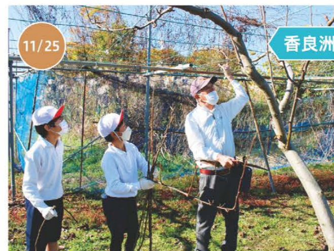
津市立香良洲小学校3年生

サツマイモの収穫時期を迎えた10月下旬から11月上旬にかけて管内各地で農業体験が行われ、地元の小学生や幼児園児らがサツマイモの収穫を楽しみました。また、香良洲小学校では香良洲梨の剪定について学習しました。