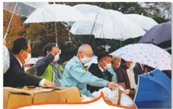
イベントの最後には来場者に 餅や菓子を配布しました!