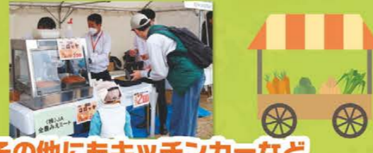
その他にもキッチンカーなど たくさんの出店がありました!