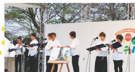
JAみえなか助け合い組織ほほえみ 読み聞かせ隊「メルヘン」による 読み聞かせ