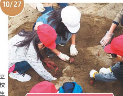
松阪市立 第四小学校 2年生