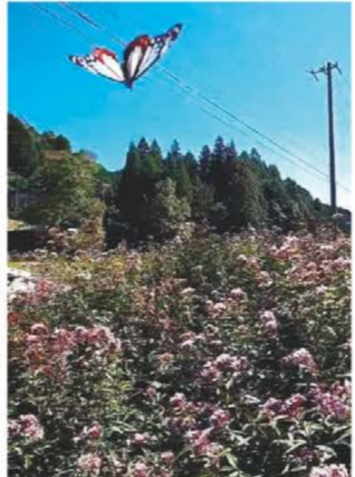
美杉のふじばかまに蝶々 津市白山町 ほっけさん アサギマダラがやってきました。 楽しそうに花から花へ飛んでいます。 ふじばかまを大事に育てて頂いた 方々、ありがとうございます。