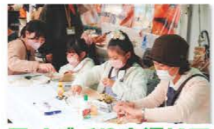
モノづくりを通じて SDGs