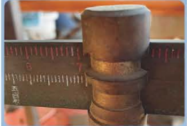
巨大なサツマイモ 松阪市小野町 まっつあかのばあちゃんさん 一株7本で7.1kg、一番長いのが31cm。 一番周りの太いのは36cmあります。