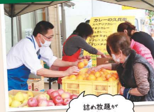
詰め放題が大人気でした