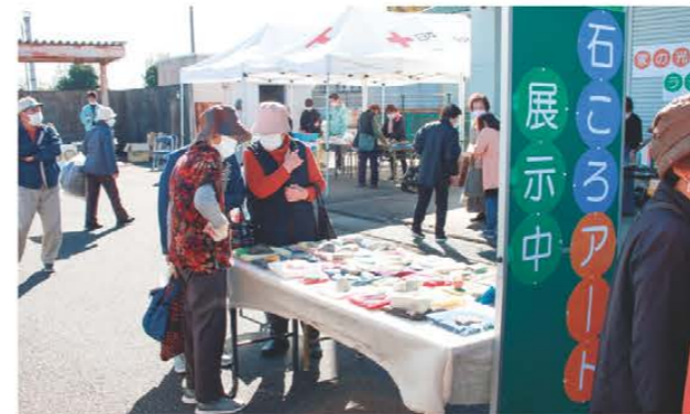
石ころアートを楽しむ来場者ら

大足店は11月6日、大足店女性部や支店運営委員が中心となり、大足店まつりを開催しました。