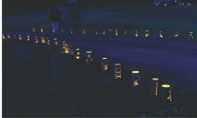
優しい光を放つ竹灯籠