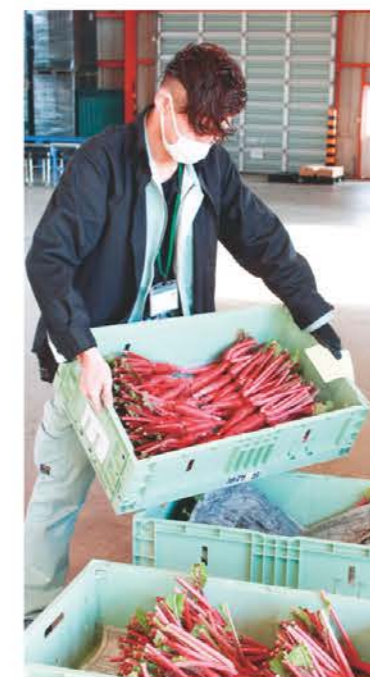
出荷された松阪赤菜

松阪西部地区では12月1日から松阪赤菜の出荷を行いました。今年度産の松阪赤菜は雨の影響で播種が遅れたことにより、例年より2週間ほど遅い出荷開始となりましたが、スツとまっすぐな形で綺麗な紅色をしたものが出揃いました。松阪赤菜は松阪市原産の伝統野菜。松阪西部の阿坂地区を中心に、8軒の農家が約26aで栽培しています。