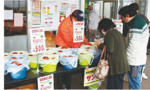
多くのりんごが並びました

きつする黒部は12月3日と4日、りんご祭りを開催し、連日多くの人で賑わいました。祭りでは産地間提携している長野県の農産物直売所あんしん市場より直送されたりんごを販売。贈答用の化粧箱入りのものから自宅用に手軽に購入できるものもあり、用意していた数量が初日の半日でほぼなくなってしまうほど人気を博していました。