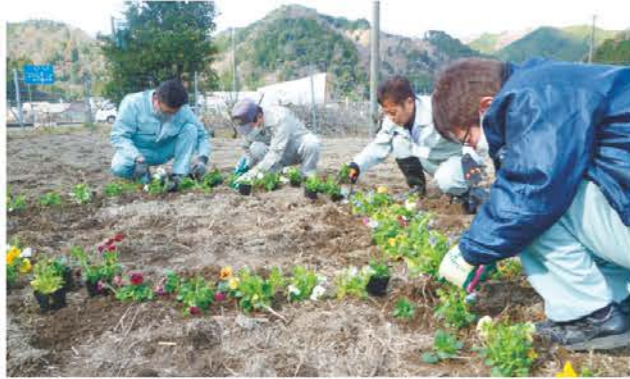
パンジーを定植する参加者

美杉支店と農作業支援センター美杉は12月7日、地元の組合員や行政と連携し、津市美杉町の休耕田に約420本のパンジーの苗を植えました。冬の休耕田を鮮やかな花で彩り景観向上を目指すとともに、圃場管理が加わることで農地としての機能を取り戻しやすくなることが期待できます。圃場の場所は道の駅美杉近隣にあることから、パンジーを「みすぎ」という文字の形に定植。見物者の目を楽しませ、同町をPRします。パンジーは春にかけて花を咲かせる予定です。