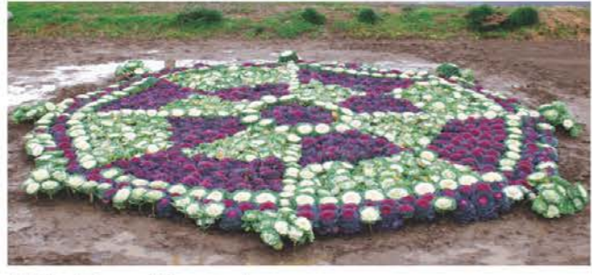
堤防の下のハボタンアート 津市須ヶ瀬町 CAPのみなさん 須ヶ瀬橋堤防の近くにありす! 2月末頃までが見頃です。是非見に来てください!