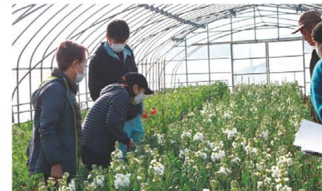
花や葉の様子から生育を確認する部会員ら

花部会は12月12日、生育巡回を行い、11人が参加しました。全体の草丈や葉色などの様子を見ながら、肥料の過不足や病害虫の発生状況などをハウスごとに確認しました。今年のストックは大きな病害虫も発生しておらず、順調な生育。12月11日から出荷が始まり、例年より2週間ほど早い出荷開始となりました。