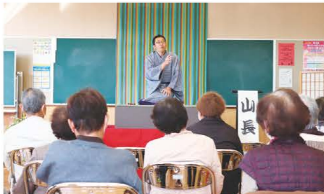
落語に聞き入る参加者

助け合い組織「かざぐるまの会」は、12月7日、津市白山町の八ツ山公民館で「ふらっとほーむ やつやま」を3年ぶりに開催し、25人が参加しました。