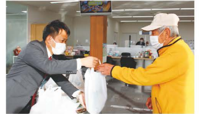
新鮮野菜の無料配布をする職員(左)

三雲支店では11月29日と30日の2日間にわたり新築オープン1周年記念感謝祭を開催しました。新鮮野菜の配布や、店内でアンケート回答者へ景品のプレゼントをすることで地域の組合員の皆さまに感謝の気持ちを伝えました。隣接の三雲営農振興センターと生活センターでも新築オープン記念イベントを開催し、両日で約300人の来場者が訪れました。