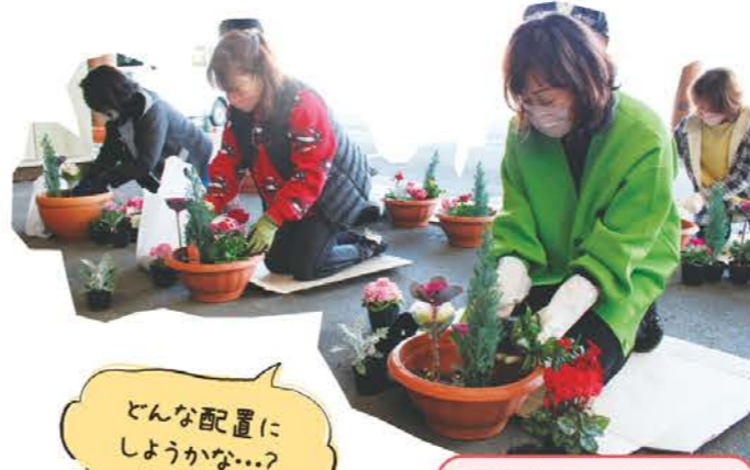
どんな配置にしようかな...?