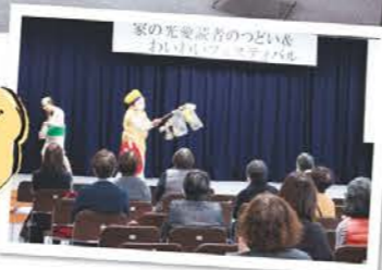
ちよんちよんキジムナーで会場を沸かせました