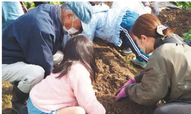
じゃがいもを掘り起こす農園会員と園児ら

松阪市にある竹林まちづくり農業体験農園で12月11日、地域の幼稚園を対象にじゃがいもの収穫体験を開き、子ども21人と保護者らが参加しました。同農園は竹林まちづくり推進協議会とJAが協力して運営する体験農園。当日は体験農園の会員なども協力、園児や保護者と一緒になって収穫を楽しんでいました。また、12月25日には地域の住民を対象に、別の圃場で白菜やダイコンの収穫体験も行い、参加者らは大きなダイコンなどを収穫し、歓声を上げていました。