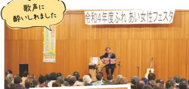
歌声に酔いれました