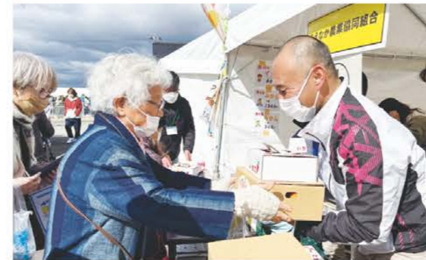
農産物販売をするJA職員(右)

三雲支店と三雲営農振興センターは2月26日、松阪市小野江町の松浦武四郎記念館で開催された第28回武四郎まつりに出店しました。当JA管内で栽培されているイチゴ、ミカン、キャベツを販売。まつりでは札幌大学によるアイヌ古式舞踊や、地元団体の出店ブースで賑わいました。毎年松浦武四郎生没月の2月に開催していますが、新型コロナウイルス感染拡大以降3年ぶりの開催となり約3,000人が来場しました。