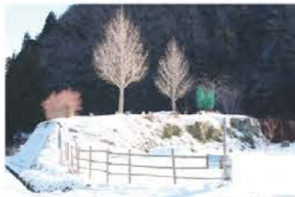
「里の丘広場」の冬 津市一志町 里山ファンクラブさん 真っ白に変身した里の丘広場が陽射しを浴びてまぶしく光ります。