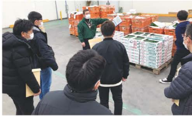
卸売市場で説明を受ける参加者ら

松阪地区青年部(JAMY)は2月13日から14日にかけて京都府で視察研修を行い、部員や関係者等合わせて11人が参加しました。京都府南部総合地方卸売市場の視察では、市場関係者から同市場の概要や京やさいブランド、旬の農産物について説明を受けました。また、祇園の散策などを行い、会員相互の親睦を深める機会になりました。