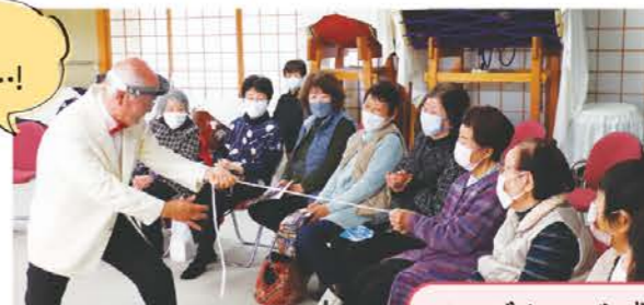
ミニデイサービス榊原