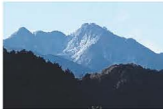
雪化粧した矢頭山 津市一志町