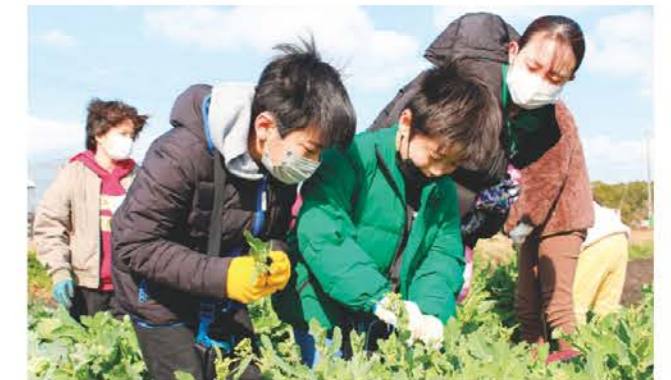
ナバナの収穫体験をする子ども達

あぐりスクールは2月25日、松阪西部営農振興センターで第6回の活動としてナバナ収穫体験、ジャガイモの定植を行い、29人の子どもが参加しました。収穫や定植の仕方を当JA営農指導員から教わると、子ども達は楽しそうに作業していました。作業後は表彰式を行い、全6回の活動に参加した子ども達には皆勤賞を、小学6年生の子ども達には卒業証書を贈りました。あぐりスクールは今年度も継続して実施します。