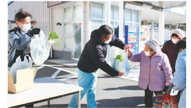
野菜を手渡すJA職員(中)

三雲営農振興センターと三雲支店は2月21日、22日に両日先着50世帯限定で野菜の無料配布を行いました。野菜は当JA三雲営農振興センター職員が試験的に栽培しているものです。午前9時の配布開始時刻前から多くの方が集まりました。今年は、ブロッコリーや辛味だいこんなどを日頃の感謝の気持ちを込めて配布し、来場者は「ありがとう」と笑顔で受け取っていました。