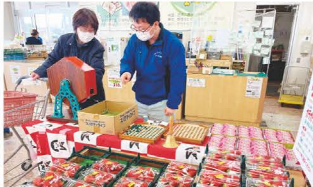
ガラガラ抽選をする参加者(左)

きっする黒部は2月18日と19日にいちご祭りを開催しました。同店内のお買い物で1,000円以上のレシートをお持ちの方には、先着250名様にイチゴが当たる抽選会を開き、1等はイチゴ2パック、2等はイチゴ1パックで抽選に外れた方へもイチゴ味のビスコをプレゼント。イチゴが当たった参加者は大喜びでイチゴを受け取るなどとても賑わっていました。開店後2時間足らずで抽選会が終了するほど大盛況でした。