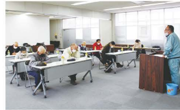
熱心に話を聞く部会員ら

秋冬野菜部会は2月24日、旧権現前店で令和5年産赤シソ栽培に向けた講習会を開き、部会員8人が参加しました。当JA三雲営農振興センター営農指導員が栽培方法について説明した後、三重県松阪地域農業改良普及センター職員から栽培中の注意点について補足説明しました。