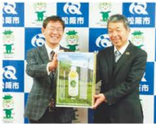
松阪市へ寄贈(1月10日)