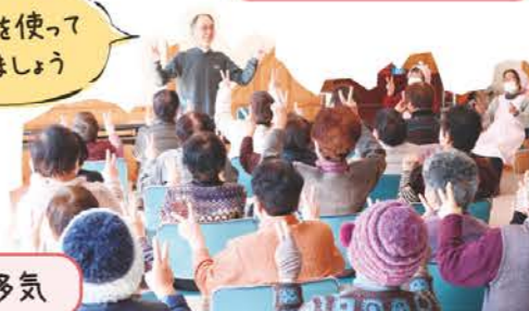
ミニデイサービス多気