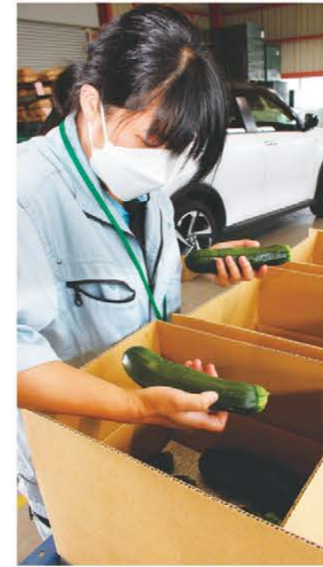
出荷されたズッキーニを確認するJA職員

松阪東部地区では5月中旬から6月中旬にかけて、ズッキーニの出荷がピークを迎えました。