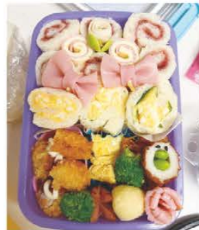
遠足の日のキャラ弁 です^^ 松阪市新屋敷町 ミスチルさん