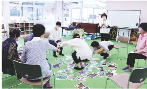
白熱するかるた大会

松阪市飯南町にある当JAのデイサービス施設「飯南シルバー」が6月1日に移転しました。以前は旧粥見支店の建物を使用していたが、老朽化が進んできたため、遊休店舗になっていた深野店の旧経済店舗を改装し、新たにデイサービス施設としました。