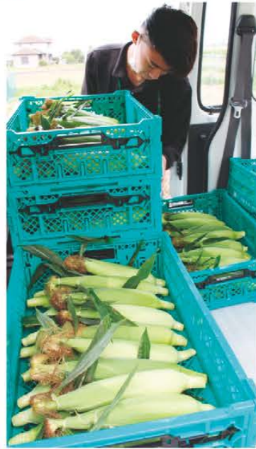
早朝に収穫されたトウモロコシを積み込む職員

当JA管内の松阪市伊勢寺地区では6月5日から朝採りトウモロコシの出荷を行いました。当JAではトウモロコシの性質を活かし、最も甘みが強くなる早朝に収穫。箱詰めせずに葉などもつけたままの状態です。早朝のうちに畑から直接市場へ出荷し、新鮮なうちに店頭へ並びます。今年のは初期生育が順調で、目立った病虫害もなく綺麗なものが出揃いました。