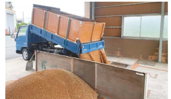
次々と麦の荷受けを行う東部カントリーエレベーター

JAみえなか管内では5月下旬から麦の収穫が始まりました。今年の麦は天候の都合で例年より刈取りが早く始まりましたが品質は良好。収量は例年より多くなる見込みです。