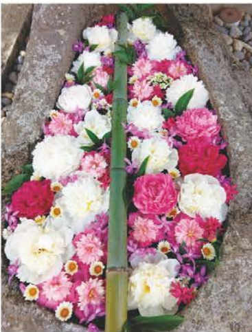
松尾神社花手水 松阪市立野町 松尾神社手芸クラブさん 持ち寄りの季節の花で作る花手水が参拝者の目を和ませています。