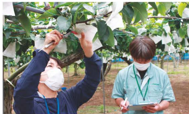
果実の大きさを測る様子

松阪地区梨研究部会は6月6日、今年度1回目の幸水の果形調査を行い、JA職員ら2人が5つの園地を巡回しました。