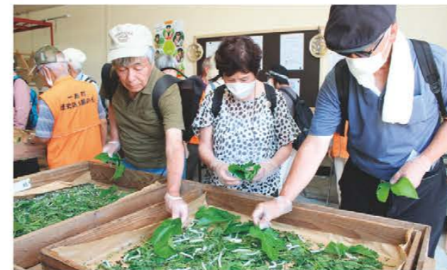
桑やり体験を楽しむ参加者ら

郷土資料館では6月1日から25日まで蚕の飼育展示を行いました。当JAでは、津市一志町でかつて盛だった養蚕業の歴史を現代に伝えるため、地域の有志で結成している「蚕糸研究会」と「一志町歴史語り部の会」が中心となり、毎年蚕の飼育展示を行っています。今年度は5月21日に掃立てを行い、皇室で飼育されている「小石丸」や黄色の繭をつくる「黄白」など3種の蚕を飼育しました。また、6月17日には、JR名松線全線復旧開通イベントの「名松線ウォーク」の一環で、参加者が桑やりなどを体験しました。