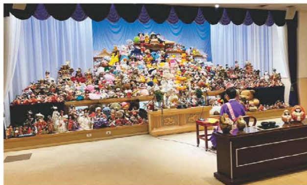
想いのこもった人形を丁寧に供養

虹のホール三雲は7月17日、人形供養祭を行い、人形やぬいぐるみなど約1,200体を供養しました。この供養祭は不定期開催しており、地域住民をはじめ多くの方が愛着のある人形にお別れをするため訪れました。