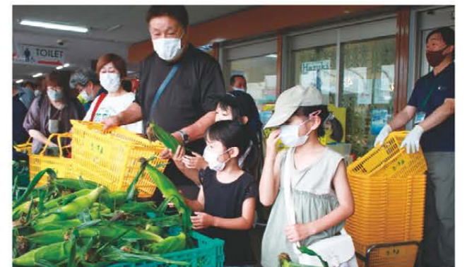
トウモロコシを次々とかごに入れる来場者

農産物直売所「きっする黒部」は7月1日にトウモロコシ祭を開催しました。JAみえなかの農業経営事業で栽培したトウモロコシを、当日の早朝から収穫し、より新鮮な状態で販売しました。