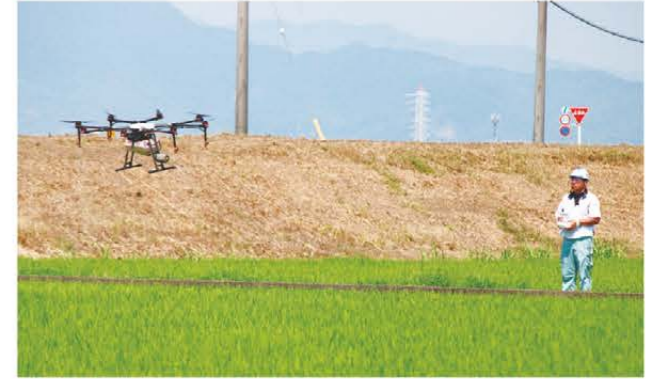
ドローンを操縦するJA職員

6月24日から8月末にかけて、管内の約660haの水稲圃場を対象に、無人ラジコンヘリコプターと農業用ドローンによる農薬の空中散布を行いました。いもち病とカメムシ類の防除を目的としており、今年は特に、三重県病害虫防除所からいもち病の注意報が発表されていたため、少しでも被害を抑えようと適期防除に取り組みました。