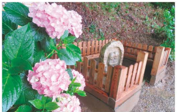
道祖神と紫陽花 津市一志町 里山ファンクラブさん 地域の方々の安全・安心を願って建立された道祖神に紫陽花が鮮やかです。