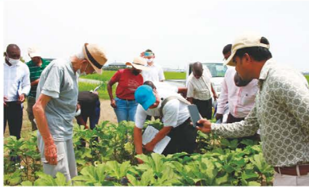
現地でオクラの栽培の様子を見学する研修員ら

松阪東部営農振興センターに7月7日、独立行政法人国際協力機構(JICA)の研修員12人がオクラの栽培について視察に訪れました。視察はガーナなど10か国の出身者が参加している、JICAの課題別研修「市場志向型農業振興(普及員)」コースの一環として実施。JA職員から集出荷や出荷基準について説明を聞いた後、生産者の圃場へ移動し、実際の栽培の様子を見学しました。