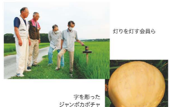
灯りを灯す会員ら