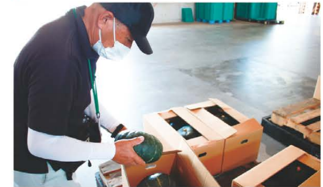
出荷されたカボチャを確認するJA職員

JAみえなかでは7月末からお盆前にかけて加工用カボチャの出荷がピークを迎えました。今年度のカボチャは病虫害の影響もなく順調に生育。特に需要の多いLサイズを中心に出荷されました。