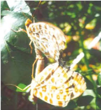
蝶の交尾 津市一志町 瀧川 尚さん 庭で偶然見つけたので写しました。