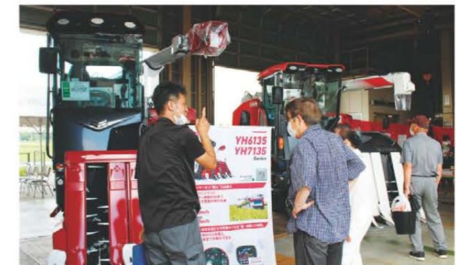
農機について相談する来場者

7月21日、7月22日に中部カントリーエレベーターにて松阪西部・一志東部地区農機展示会を開催しました。チップソーや刈払機・管理機、茎葉除草剤の特別価格、大型農機の展示を行い365人の来場者でにぎわいました。