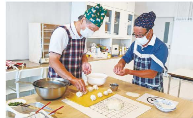
いなり寿司のご飯を握る参加者

三重中央地区友好会員組織は7月21日に「男の料理教室」を開催し9人が参加しました。