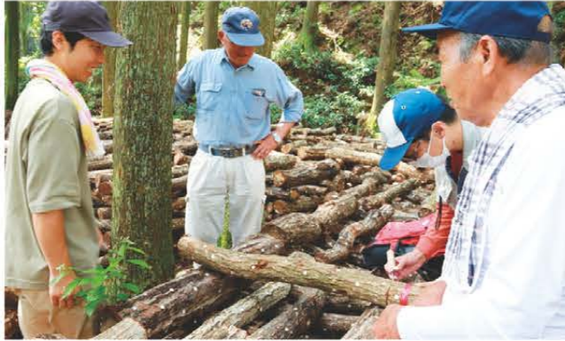
菌の回り具合を確認する参加者ら

JAみえなか乾椎茸部会は7月11日、松阪市で乾椎茸活着研修会を開きました。部会員や関係者等合わせて9人が参加し、3か所のほだ場を回って菌の回り具合を確認しました。