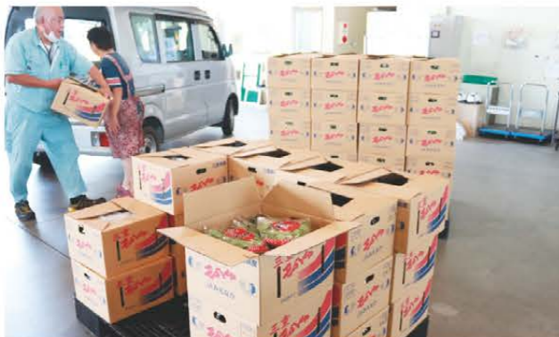
出荷されたモロヘイヤを下ろす職員

JAみえなかでは7月中旬ごろからモロヘイヤの出荷がピークを迎えました。当JAは三重県内トップのモロヘイヤ産地で、県内生産量の約7割を担っています。