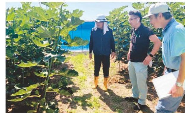
生育確認をする部会員とJA職員

8月上旬を迎えるイチジク出荷を前に、7月25日、当JA三雲営農振興センターの営農指導員と松阪農業改良普及センター職員が松阪市三雲地区内の園地を巡回しました。同JAいちじく部会員7戸の園地で、木の高さや葉の様子、果実を見て生育遅れの有無や病虫害の影響を確認。今年は病虫害の被害も少なく生育は順調。部会員へ高温と乾燥対策について指導を行いました。同地区のイチジクは昭和45年ごろに水稻の転作作物として栽培を開始。約1.8haの面積で栽培されており、三重県内で1位のシェアを誇ります。