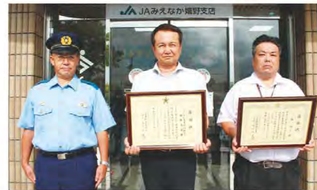
感謝状を贈呈された嬉野支店職員

嬉野支店は9月11日、特殊詐欺の未然防止で松阪警察署から感謝状を贈呈されました。同支店の職員が8月中旬、当JA管内在住の男性にATMでの振込操作方法を聞かれ、その慌てた様子から振り込め詐欺を疑い、家族や警察への相談を勧めました。同日男性は警察署に相談を持ちかけ、振り込め詐欺と発覚し、被害を防止することができました。身に覚えのない請求や、「早く振り込んでください」という言葉は詐欺の手口です。一人で悩まず、必ず家族や知人、警察への相談をしてください。