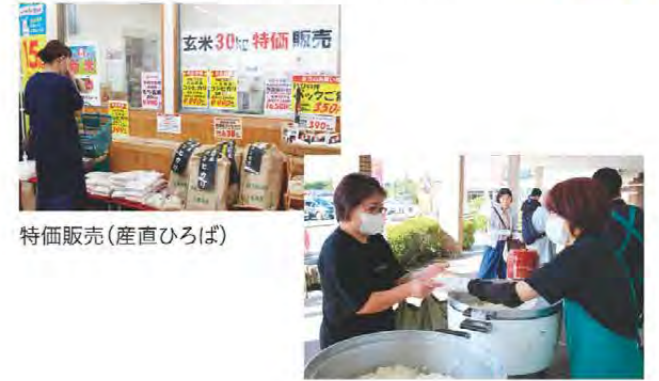
特価販売(産直ひろば)