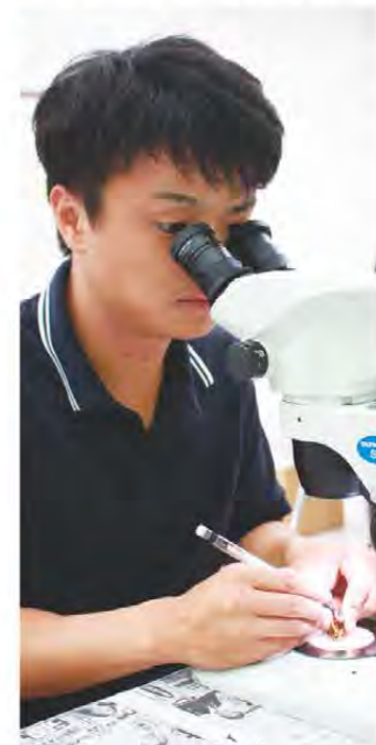
顕微鏡で花芽分化を確認する普及センター職員

毎部会松阪支部は9月8日からイチゴ苗の花芽分化調査を行いました。花芽分化の状況を確認することで、生育状況と定植適期を見極め、開花遅れを防止し、収量減少などの栽培全体への影響を防ぐことができます。生産者が任意で提出した苗のクラウンの直径や窒素濃度などを計測し、株の状態を確認。その後松阪地域農業改良普及センター職員らが顕微鏡で花芽の分化状況を確認しました。同支部では64戸の生産者がすっきりとした甘さが特徴の「章姫」を中心に、「かおり野」「紅ほっぺ」を栽培しています。