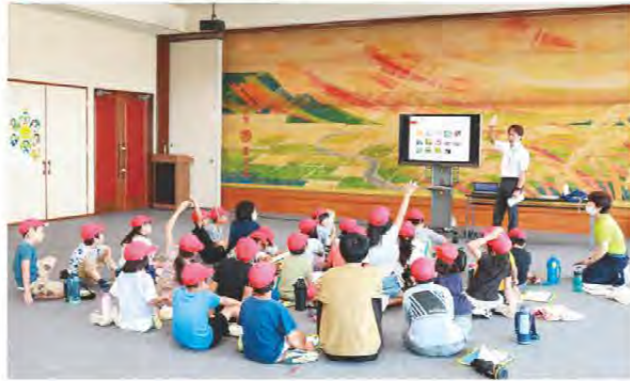
積極的に質疑応答する児童ら

9月11日、掃水小学校2年生児童28人が地域学習の一環として、当JA本店を見学しました。本店を見学後、職員がどんな仕事をしているのか説明。その後、業務内容紹介の一環としてJAみえなかのYouTube動画を視聴しました。最後に本店から見える小学校の景色を見て、児童たちはいつもと違う視点から見る自分たちの校舎を嬉しそうに見ていました。