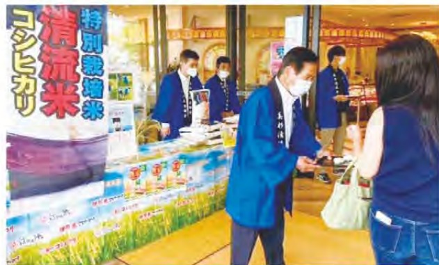
試食を配布しPR活動をする部会員

美杉清流米部会は9月30日、愛知県名古屋市にある株式会社サポーレ熱田伏見通店で美杉清流米の販売会を行いました。同部会からは2人が赴き、訪れた来店者へ試食のおにぎりを配布しながら生産にかける思いを伝えるなど消費者との交流やPRを行いました。株式会社サポーレでは約20年前から美杉清流米を主力商品として販売しています。