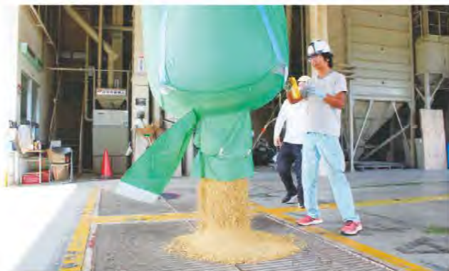
荷受け作業に追われるJA職員

管内では8月上旬から水稲の収穫が始まり、職員は荷受け作業や米検査の作業に追われました。管内全域では4,794haで「コシヒカリ」「キヌヒカリ」「キヌムスメ」「三重23号」等様々な品種を栽培しています。