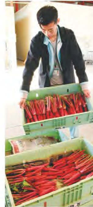
出荷に追われるJA職員

JAみえなかでは12月上旬から松阪赤菜の出荷を開始しました。松阪赤菜は松阪市阿坂地区で栽培されており、みえの伝統野菜に登録されています。日野菜の原種とも言われていますが、日野菜よりも太くて根と葉の軸が美しい紅色をしていることが特長。今年度産は、雨量が少なく秋の残暑が続いたことから10月初旬に播種を実施。病害虫の発生が多く見られましたが防除を徹底し、白サビ病もなく例年並みに生育は良好でした。出荷は3月まで続き、400キロを超える出荷を見込んでいます。