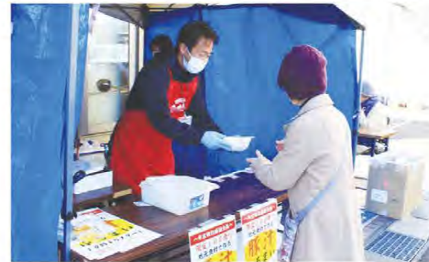
ふるまいを手渡す職員

あぐりネット三重中央・JA産直ひろばは12月23日から30日にかけて、クリスマス&歳末謝恩セールを開催し、多くの方が来店しました。期間中は玄米、精米、オリジナル加工品の販売のほか、日替わりイベントを開催。また、28日は、店舗で500円以上購入いただいた方先着100人に、地元の農産物と一揆味噌を使用した豚汁をふるまい、1年間の感謝を伝えました。