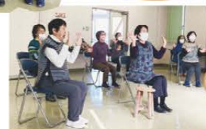
スコップ三味線グループ「SCOP」の皆さん