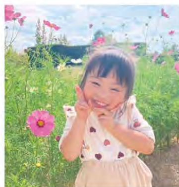
コスモス畑で、はい! ポーズ (^.^) 松阪市新屋敷町 ナンキンハゼさん