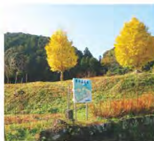
里の丘広場の秋 津市一志町 里山ファンクラブさん 並んだ2本のイチヨウは、広場のシンボルツリーです。