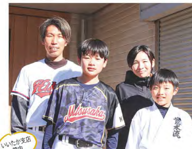
いいつか支店 管内