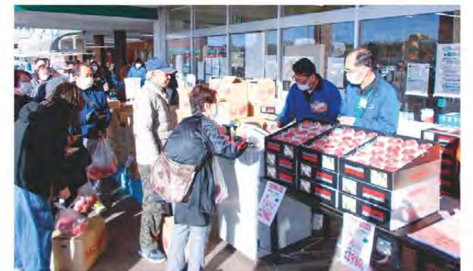
多くの人が並ぶ店頭

きっする黒部は12月2日と3日の2日間、りんご祭りを開催しました。産地間提携を行っている長野県のあんしん市場から当日直接運ばれてきたりんごを店頭で販売。化粧箱入りものから、パケツ盛りの手頃なものまであり、多くの方が買い求めていました。また、ぬくいの郷でも12月9日にりんごの店頭販売を行い、こちらも大盛況でした。