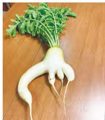
なぜ? 足がいっぱい大根 津市美杉町 匿名希望(94歳)さん 今期もユニークな大根が採れました。