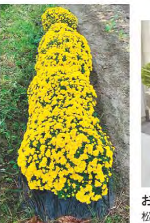
待ちに待ったドーム菊の蕾がやっと開きました! 松阪市川井町 石のさん