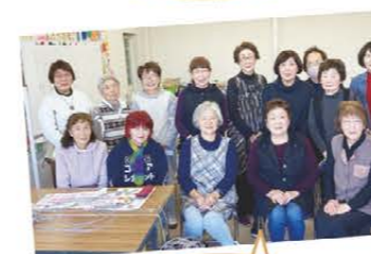
クラフト教室の皆さん