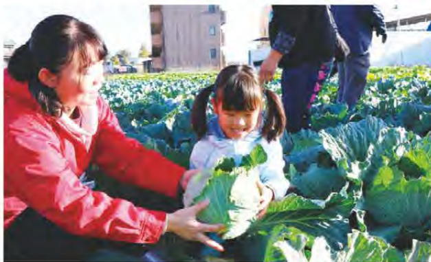
キャベツを収穫する参加者

竹林まちづくり推進協議会は12月10日、松阪市にある体験農園で、地域住民等を対象に収穫体験を開きました。同協議会員やJA職員らが定植し、栽培管理した白菜、ダイコン、キャベツ合計1,500株ほどを参加者が欲しい分だけ収穫し、持って帰ることができる企画で、約400人が参加しました。親子で参加する人も多く、子ども達は自分より大きな白菜を抱えて収穫していました。また、体験後はガラポン抽選会にも参加し、楽しい時間を過ごしていました。