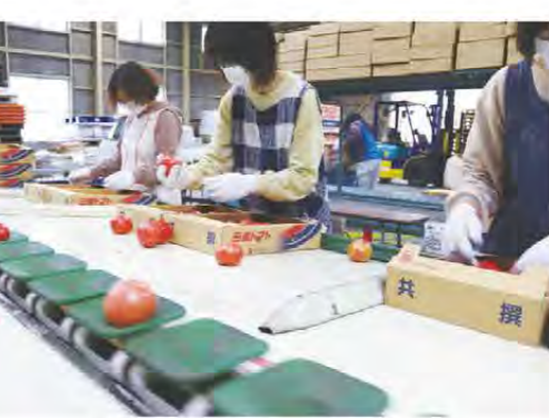
丁寧に箱詰めしていききました

管内では4月1日から田植えが始まりました。今年には桜の開花が遅かったことから、満開の桜の下で田植えが始まった地域もあり、春らしい風景となりました。 10日からはあきたこまちの田植えを始めた生産者は、今年には桜が遅く、桜の中で田植えができるのは久しぶり。花を見ながらの田植えも良いと話していました。