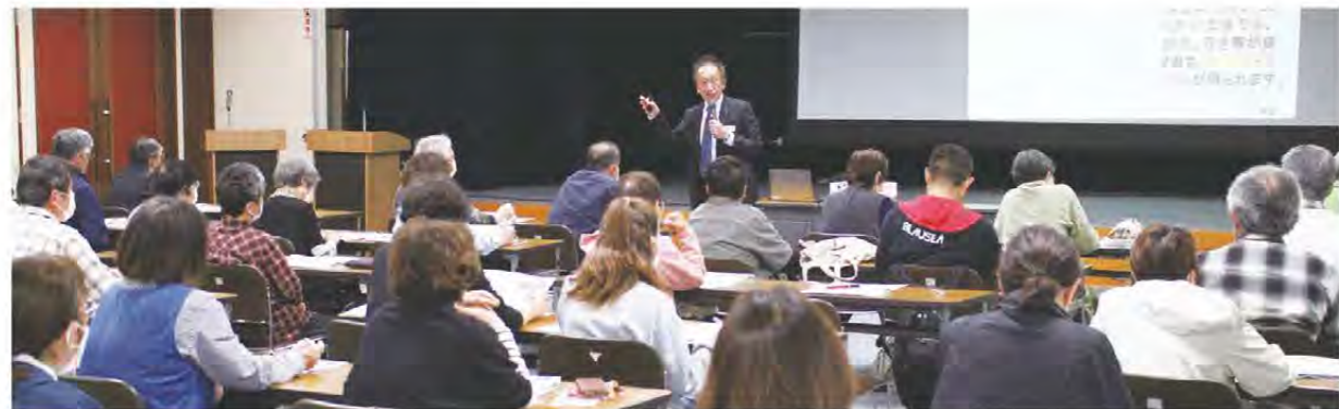
皆さん熱心に記念講演を聞いていました(菜園塾)