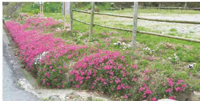
「里の丘広場」の芝桜 津市一志町 里山ファンクラブさん ..... 地域の人の協力で植えられた芝桜のピンクが鮮やか です。