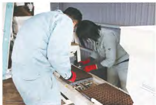
1粒ずつ確認しながら播種しました