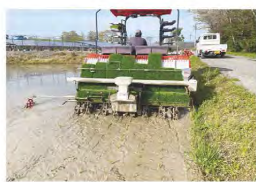
春らしい農繁期の始まりとなりました