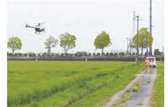
ラジヘリを使って防除する職員

当JA管内では4月中旬から各地でラジコンヘリコプター等による麦の防除を行いました。今年作の麦は暖冬傾向に進んだことから例年より少し早めに生育しており、順調。赤カビの発生を防ぐため、ラジコンヘリコプターやドローンを使い、風向き等に気をつけながらオペレーターが早朝から各エリアを回って防除しました。管内では89軒の生産者が小麦と大麦合わせて約2,280haの面積で栽培。収穫は5月末から始まる予定です。