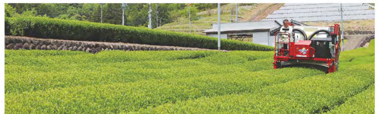
生産者は茶の刈り取りに追われました(松阪市飯南町)