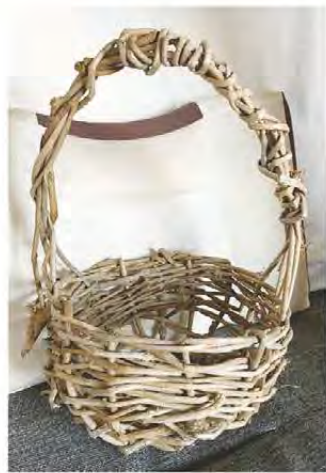
蔓で籠を編みました 松阪市新屋敷町 ナンキンハゼさん