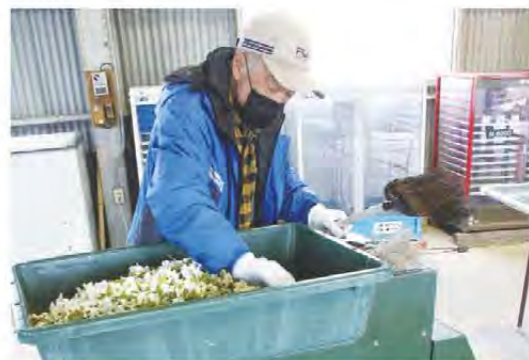
多くの花蕾が持ち込まれました

久居果樹振興協議会は4月上旬、梨の約から花粉を取り出す開花作業がピークを迎えました。同地区では生産者が採集した花蕾を、当JA小野辺集荷場へ持ち込み、JA職員等が開花を行っています。寒の戻りや3月末の日照不足で開花が遅くなり、4月の最盛期には1日約20kgが採集されました。同協議会では37人が梨を栽培し、「ひさい梨」のブランド名で販売しています。8月上旬から「幸水」や「豊水」を出荷する予定です。