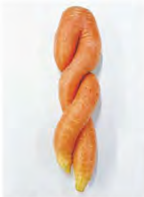
スパイラルニンジン 津市須ヶ瀬町 A氏さん