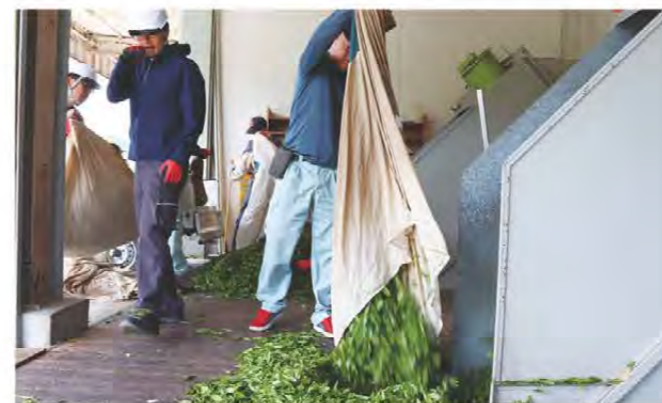
多くの生葉を荷受けしました

管内では5月上旬に新茶シーズンを迎え、各地で生産者による茶の刈り取りが行われました。松阪市にあるJA粥見茶工場は5月2日から荷受けを開始。初日は約12トンの生葉を受け入れられました。今年度の茶は雨が多く、順調に生育。3月に気温の低い日が続いたことから、昨年より5日遅れての荷受け開始となりました。また、4月24日にはJA全農みえ南勢茶センターで茶の初市が行われ、最高値は1kgあたり5万5,500円で取引されました。