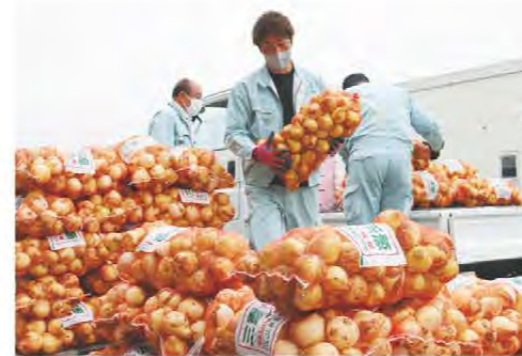
たくさんのおタマネギが出荷されました

松阪東部地区では3月から新タマネギの出荷が始まり、4月下旬からゴールデンウィークにかけてピークを迎えました。集荷場にはネットに詰めたタマネギをたくさん載せたトラックが次々に訪れました。今年のおタマネギは例年より少し早めに生育し、やや2Lサイズが中心の大き玉傾向となりました。管内では33軒の農家がタマネギを栽培。極早生品種のアップや早生品種のソニックを栽培しています。