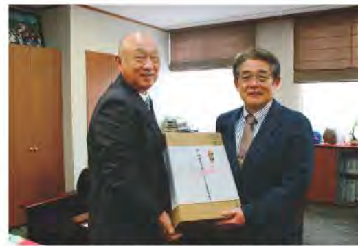
選抜高校野球大会出場おめでとうございます