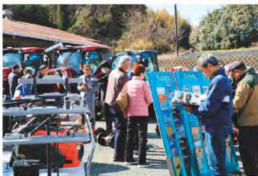
多くの大型農機が並びました