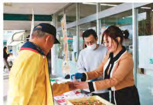
試食していただいた皆さんありがとうございました