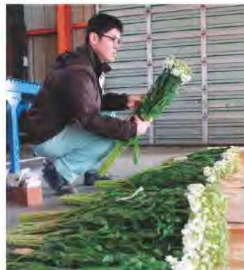
色とりどりのストックが出荷されました

花部会は12月からストックの出荷を行い、2月中旬にピークを迎えました。ストックはまっすぐに伸びた茎にふわふわとした花が集まって咲くのが特徴的な花で、色の種類が多く、香り豊かで見た目が華やかなことから、冠婚葬祭やギフト等にも多く使われています。出荷されたストックは一つひとつ営農指導員が丁寧に検品を行い、箱詰めして出荷しました。管内では、4戸の生産者が約10aで栽培。今年度は3月まで県内や愛知県の市場に向けて出荷が続きました。