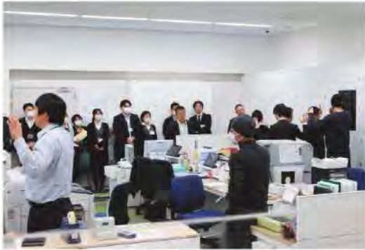
緊張感が漂いました