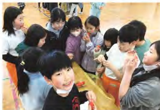
おいしく楽しく学びました