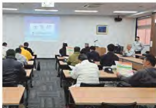
熱心に研修を受講しました

J Aみえなか青壮年部は、2月12日と13日の2日間にかけて静岡県の静岡製機株式会社を視察し、部会員11人が参加しました。同社は、農業用の設備機器や測定分析装置を製造している会社で、まず独自技術のモノづくりについて座学で学んだ後、乾燥機の組み立てラインを見学。部会員は担当者と機能や性能等について熱心に意見交換をしていました。また、同社が運営に携わる農産物直売所「とれたて食楽部」も見学し、部会員は興味深く商品を手にとっていました。