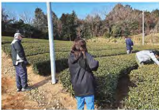
適切な指導を行いました