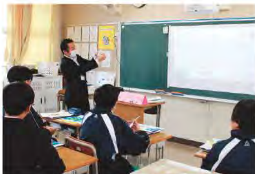
お金の知識を身に付けてもらいました