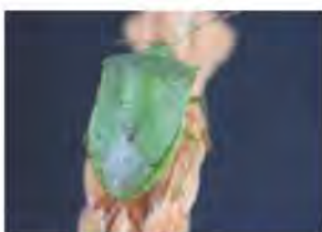
ミナミアオカメムシ