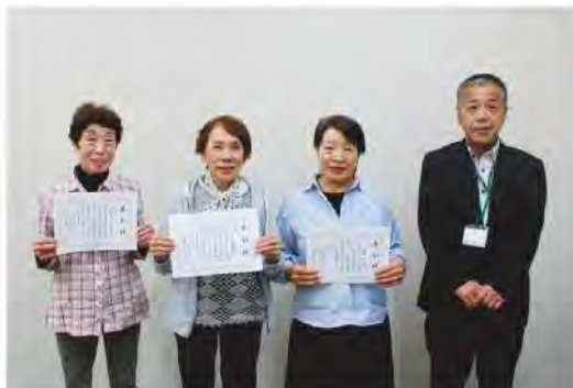
今後とも活動に励みます

ボランティア隊「えがお」は4月23日、松阪中央総合病院で実施している「病院ボランティア」の会員の中から、より多く活動された会員の表彰を行いました。