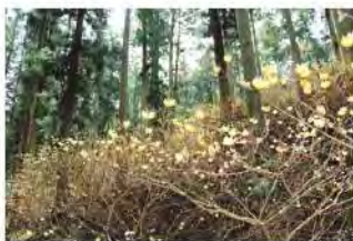
美杉のみつまた 津市一志町 里山ファンクラブさん ..... 丸い黄色の花が、かわいいです。