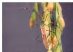
クモヘリカメムシ