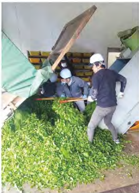
荷受けをするJA職員