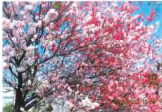
源平花桃 津市垂水 シルクさん ..... 絞りと多彩な花色を持つ美し い花桃です