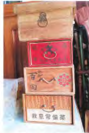
昭和の置き薬 松阪市 つばめのpapaさん ..... 祖父は、薬が好きだったのかな!