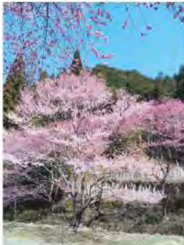
飯南町春谷寺の江戸彼岸桜 松阪市飯南町 なみちゃんさん ..... 400年もの年月、花を咲かせてます。