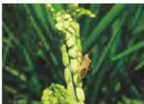
ホソハリカメムシ