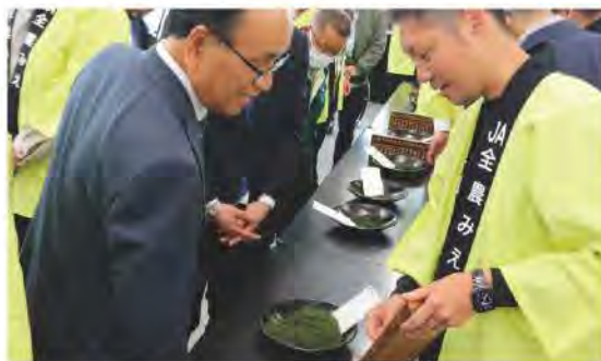
平均単価は昨年よりも倍増しました