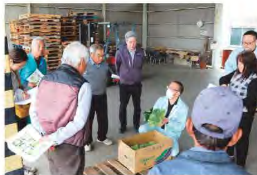
出荷規格を再確認しました

キャベツ・はくさい部会は4月9日、津市久居にある新家集荷場と元町集荷場で春キャベツの目ざろえ会を開き、部会員や市場関係者、合わせて16人が参加しました。3月後半から出荷が始まり、出荷最盛期を前に出荷規格等を統一。同部会員が収穫したキャベツをもとに確認し、適切な出荷方法を申し合わせました。 今年度の春キャベツは11月の定植後の乾燥もなく、暖かい気候と適度な降雨に恵まれ、順調に生育し品質は良好。6月上旬まで京阪神や県内の市場を中心に出荷が続きます。