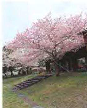
野原公園の桜..... 野原公園の桜を撮影しました!