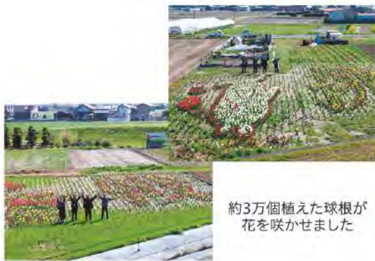
約3万個植えた球根が花を咲かせました