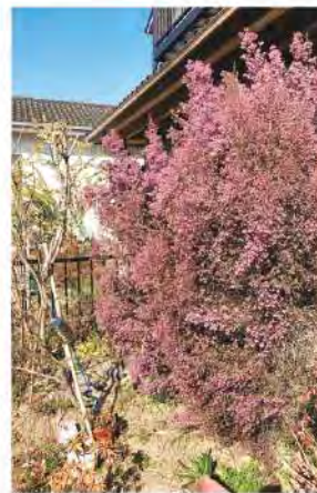
満開のエリカ 松阪市新屋敷町 ミモザさん