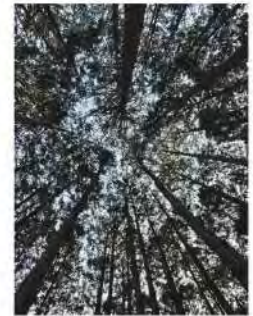
白米城の裾にて 檜林を見上げたら 松阪市小野町 まつつあかのばあちゃんさん