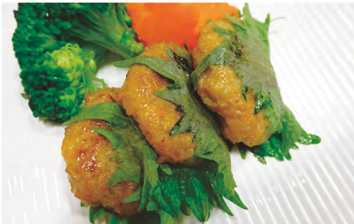
※写真は盛り付け例